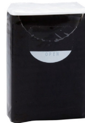
Paquet de mouchoirs personnalisable